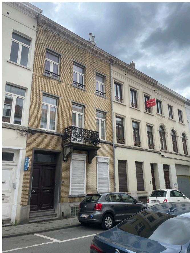
Photo 3 Mitoyen droit