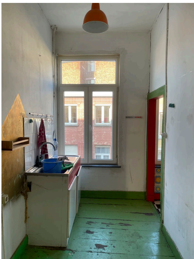
Photo 12 Etage 2 - cuisine