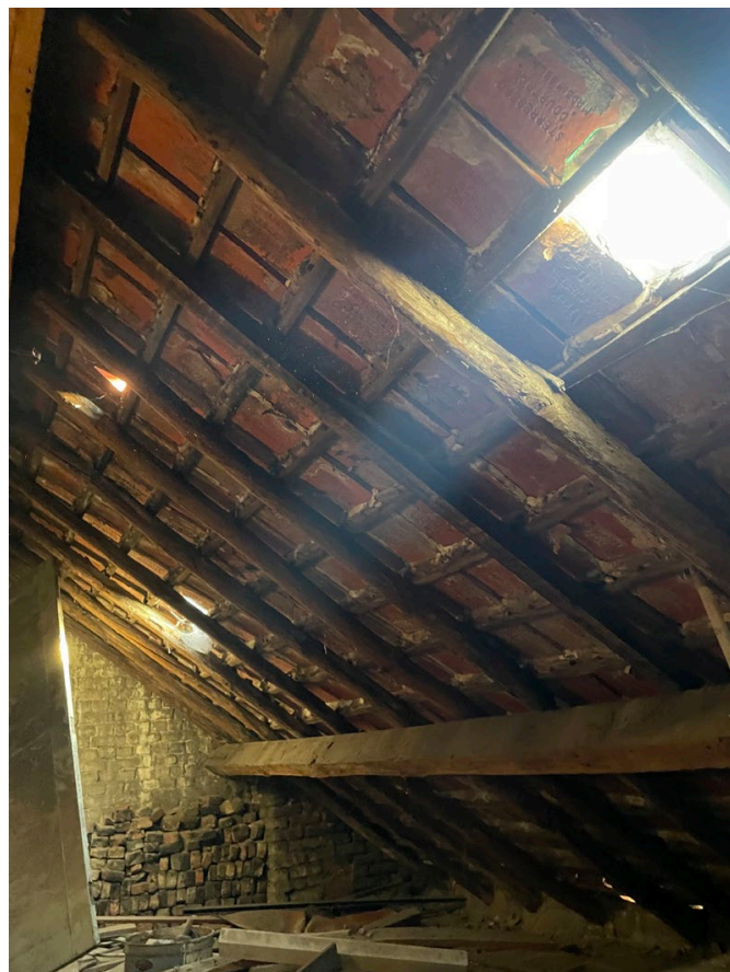
Photo 20 Comble