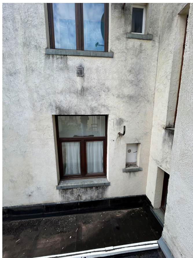
Photo 5 Vue intérieur d'îlot vers mitoyen droit