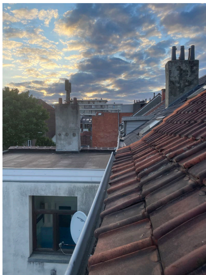
Photo 22 Vue toiture arrière