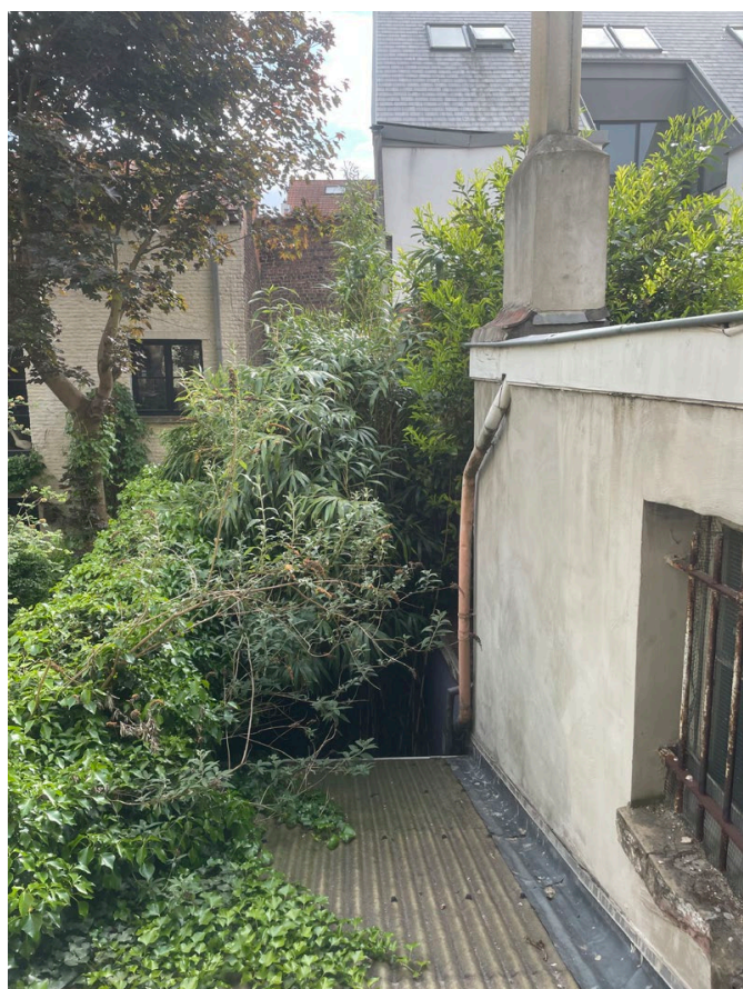
Photo 8 Façade arrière - jardin