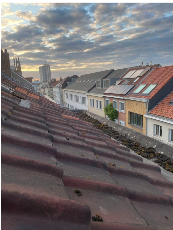
Photo 21 Vue toiture avant