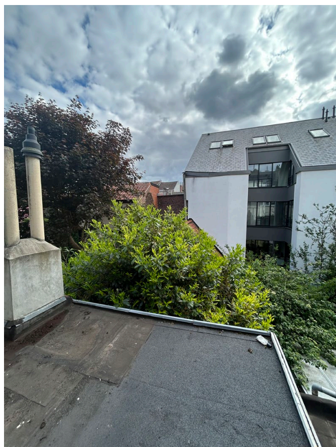
Photo 9 Façade arrière - jardin