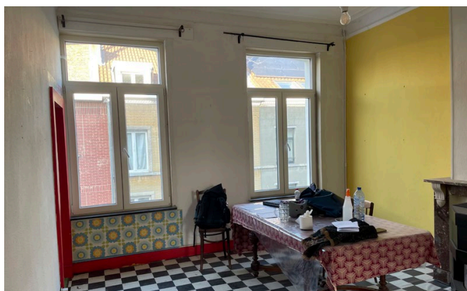
Photo 13 & 14 Etage 2 - salon et séjour