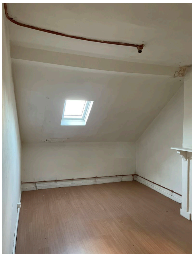
Photo 17 Etage 3 - chambre à rue