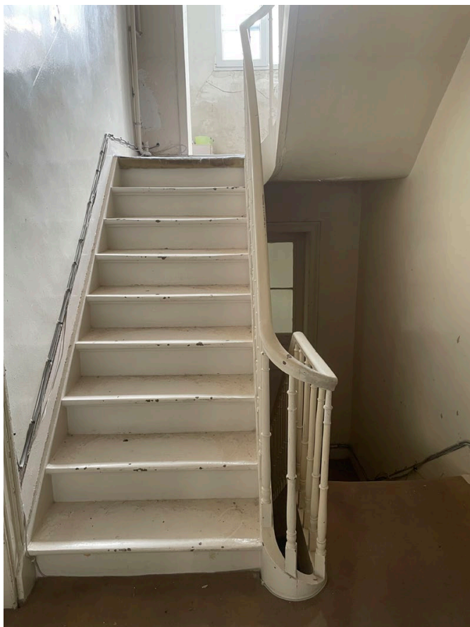
Photo 10 Escalier vers Etage 2