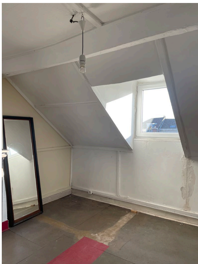
Photo 18 Etage 3 - chambre jardin