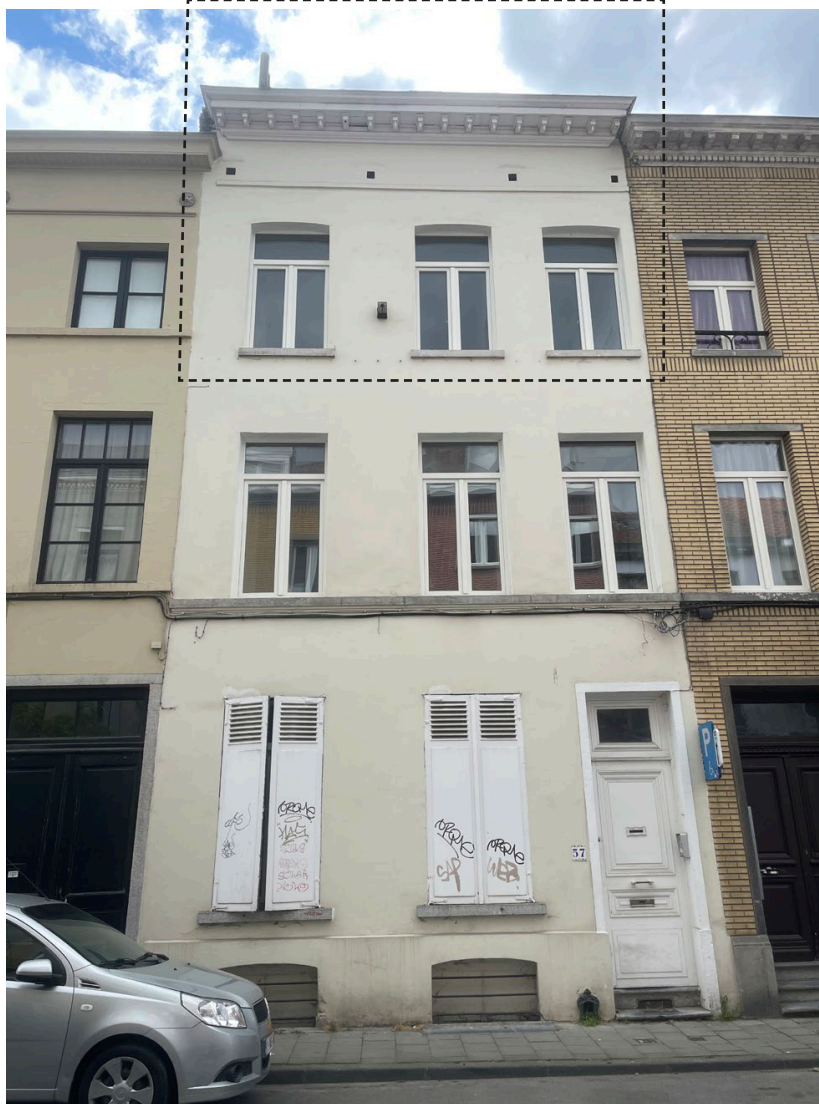
Photo 1 Façade à rue