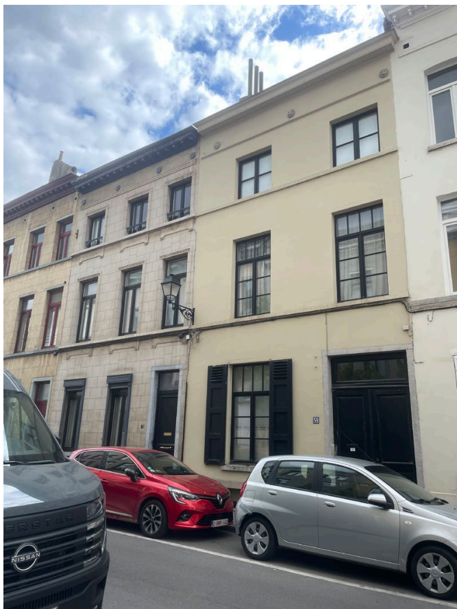
Photo 2 Mitoyen gauche