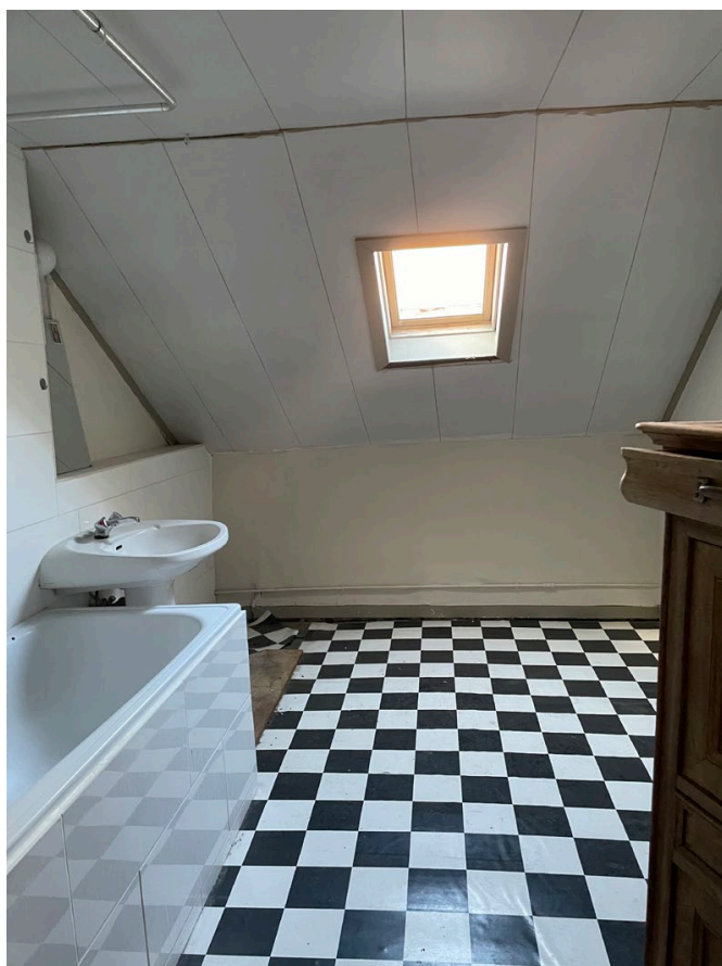
Photo 16 Etage 3 - salle de bain