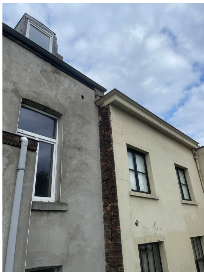
Photo 7 Façade arrière