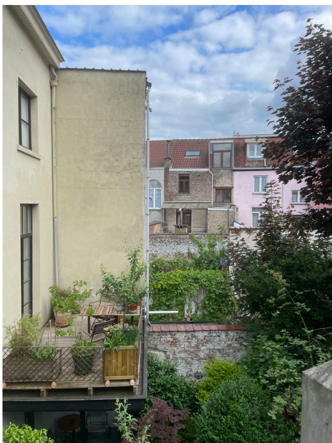
Photo 4 Vue intérieur d'îlot vers mitoyen gauche