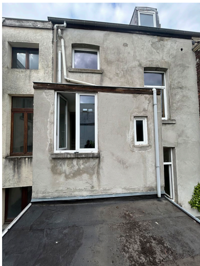
Photo 6 Façade arrière