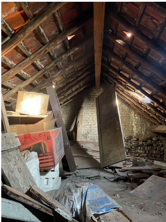
Photo 19 Comble