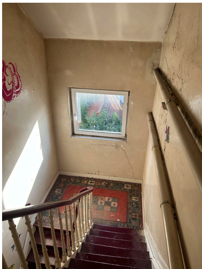
Photo 15 Escalier vers Etage 3